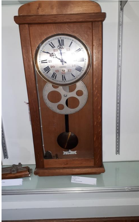
Turmuhre Kirche Seon Hergestellt J.G Baer Turmuhrfabrik Sumiswald